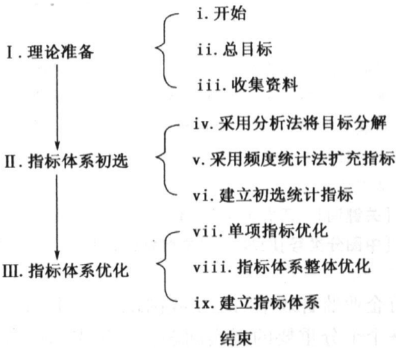
图 2 指标体系构建过程图

指标体系的构建过程是一个从具体到抽象再到具体的辩证逻辑思维过程, 是人们对现象总体数量特征的认识逐步深化、逐步求精、逐步完善、逐步系统化的过程。过程如图 2: